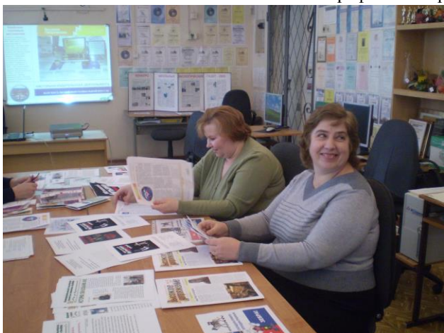
Фотографии мастер-класса 20 февраля 2013 года