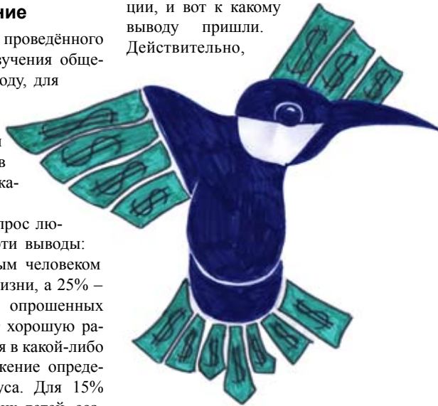
Рисунок Эллины СБИТНЕВОЙ

В поисках формулы мы обсудили определение успеха с членами нашей редакции, и вот к какому выводу пришли. Действительно,