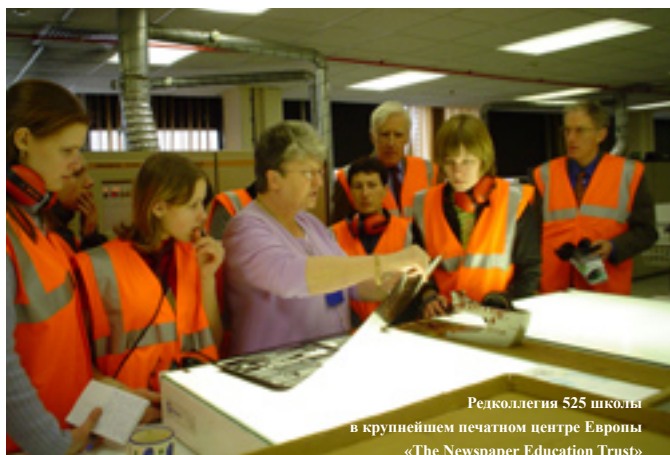
Редколлегия 525 школы в крупнейшем печатном центре Европы «The Newspaper Education Trust»